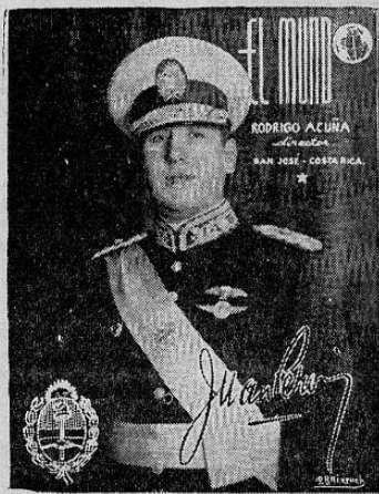
General Juan Domingo Perón

Compañeros: El pueblo de la República, en un plebiscito jamás realizado por su pureza y por su ecuanimidad, ha establecido en una asamblea soberana que la ley suprema de la Nación, dada por ese pueblo, sería la Constitución Justicialista. Hemos de recordarles a quienes intenten levanta-