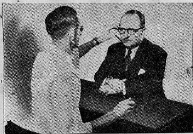
PREPARACION DE RECETAS DE OCULISTAS

Y para terminar: La desigualdad política entre hombre y mujer hace mucho tiempo que desapareció en los Estados Unidos. La mujer puede votar lo mismo que el hombre y lo mismo que el hombre puede ser elegida para el desempeño de un puesto público.